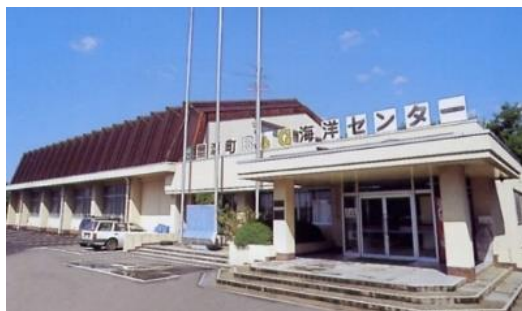
黒瀬 B&G 海洋センター